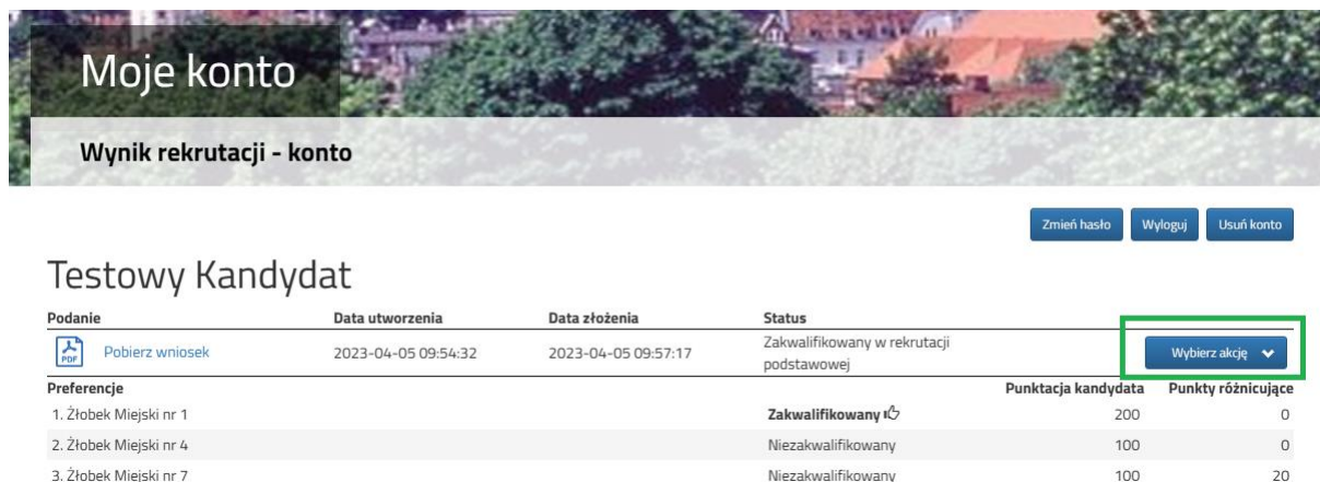
Rysunek nr 1

Po ogłoszeniu wyników kwalifikacji rodzice/opiekunowie dzieci zakwalifikowanych będą mogli złożyć potwierdzenie woli przyjęcia elektronicznie . W tym celu należy zalogować się na konto, następnie przy wniosku dziecka zakwalifikowanego kliknąć przycisk Wybierz akcję (Rysunek nr 1).